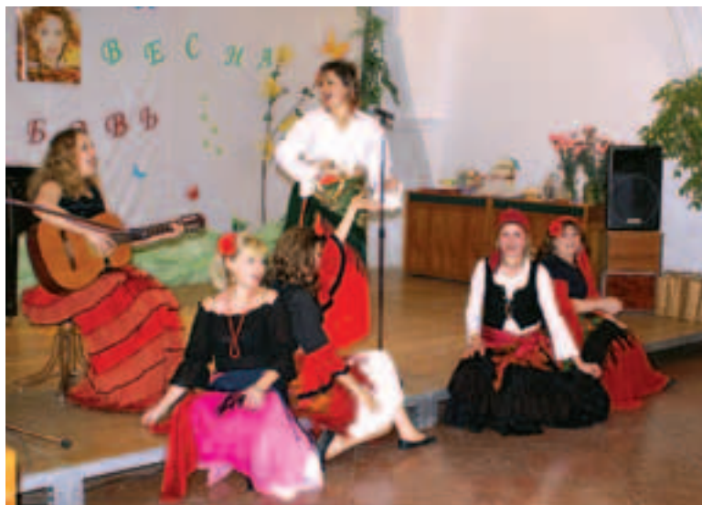
Při vystoupení souboru Sudaruška se energie z pódia lehce přenášela na diváky.